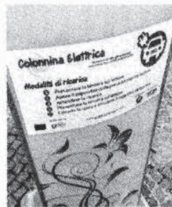
La colonnina in piazza Vittoria

Per accedere al servizio è necessario recarsi alla biglietteria Mom di piazzale Duca D'Aosta, compilare un modulo di richiesta per entrare in possesso della tessera (verrà richiesta una cauzione di 10 euro). Chiunque può farne richiesta, residenti e non del Comune di Treviso. Sono già 4 le domande arrivate. Mom ha scelto di fornire il servizio attraverso una